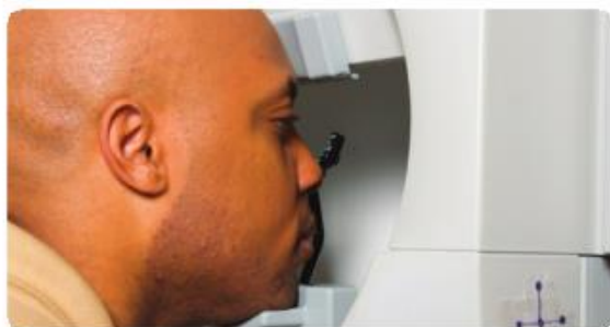
Un examen del campo visual es realizado para evaluar la visión periférica o lateral.