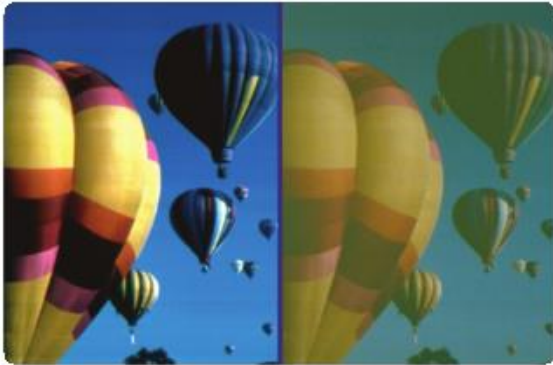
A la izquierda, una visión normal. A la derecha, una visión con falta de brillo o amarillenta.