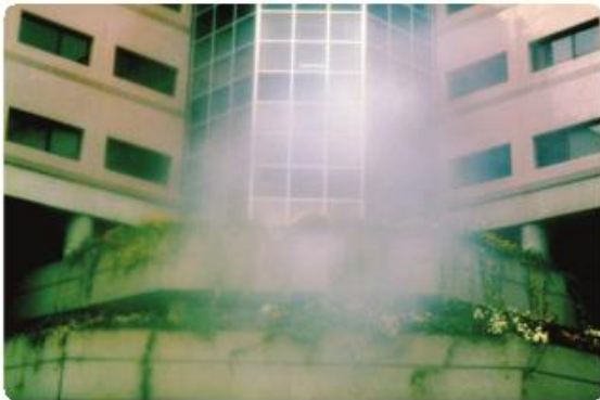
Visión borrosa u oscura.